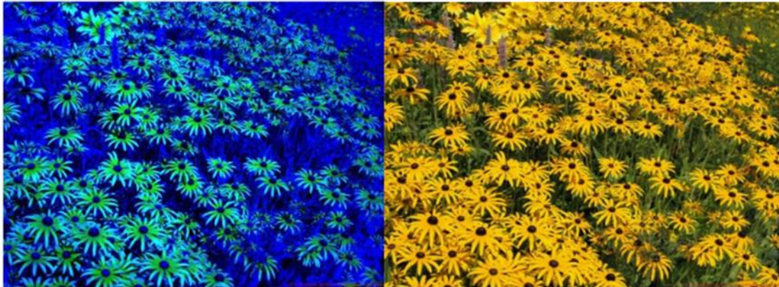
Slika 22: Primer, kako čebela vidi rumene cvetove (levi del fotografije), vir:

Najpomembnejša paša za čebele v Sloveniji je gozdna paša , saj je kar 60 odstotkov površine naše države prekrivane z gozdovi. Vendar tudi vsak izmed nas lahko prispeva k ohranitvi čebel in ostalih oprasovalcev, in sicer s sajenjem medovitih rastlin . Čebelam gre v slast nektar melise, sončnice, mete, žajblja, timijana, šetraja, ognjiča, rožmarina, marjetice, modrocvetne kadulje, regrata, spominčice, oljne ogrščice. Pojdi na sprehod in opazuj, če v svojem okolju najdeš katero od teh rastlin. Pomagaj si s fotografijami iz knjige ali spleta.