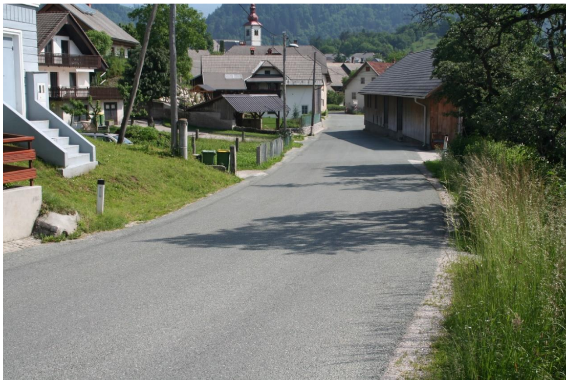
Slika 2: DRŽAVNA CESTA – SMER OD PETAČA OB DRŽAVNI CESTI

Na območju Gorij in okolice smo slikali in opisali najbolj nevarna mesta na cestah in križiščih: