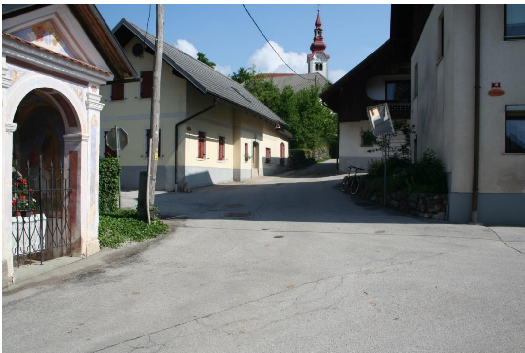
Slika 6: KRIŽIŠČE V VASI – ZGORNJE GORJE 19