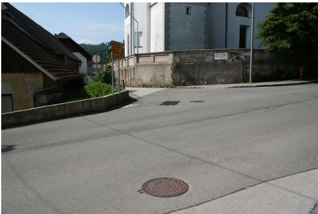
Slika 5: KRIŽIŠČE PRI CERKVI