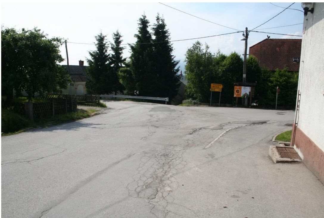
Slika 4: KRIŽIŠČE PRI MERKATORJU IN ČERNETU