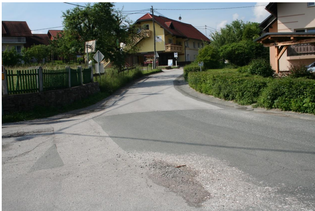
Slika 3: KRIŽIŠČE VINTGAR – FORTUNA