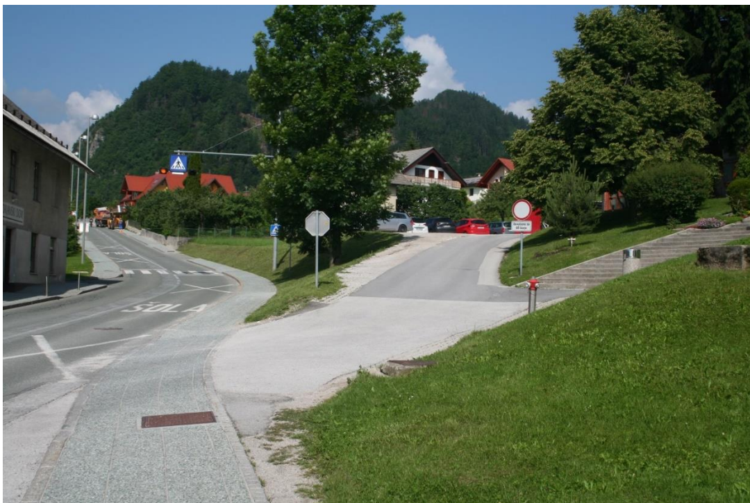
Slika 7: KRIŽIŠČE PRI ŠOLI