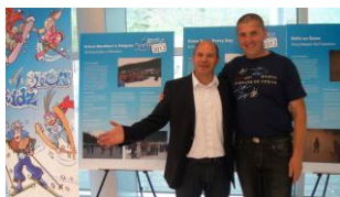
Plakat ŠPM in Marc Girardelli