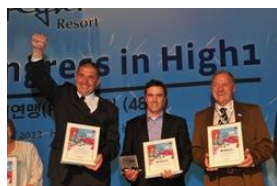
3. mesto ŠPM – 48. Kongres FIS Kangwonland, Južna Koreja, 30. 5. 2012